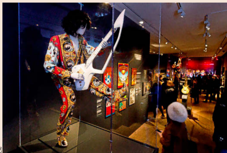
Vista de una guitarra y un traje usado por Prince, en el MET de Nueva York.

Organizado temáticamente, Toca más alto explora cómo los músicos adoptaron y avanzaron las tecnologías emergentes; el fenómeno de los dioses de la guitarra; la elaboración de una identidad visual a través del uso de instrumentos e incluso de su destrucción en algunas actuaciones en vivo, uno de los gestos más característicos del rock . Así, la muestra presentará una escultura hecha de lo que quedaba de una de las guitarras eléctricas que Pete Townshend, de