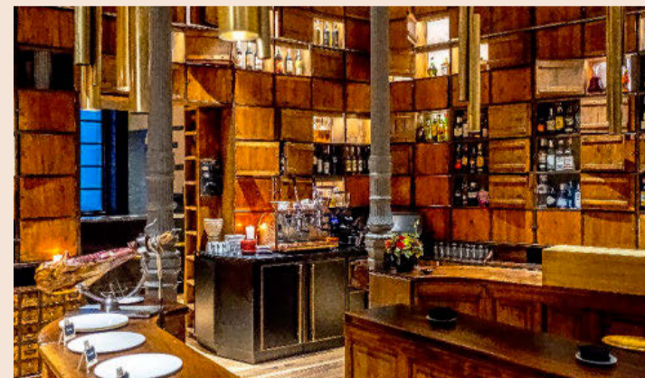
El local mantiene varios elementos del antiguo negocio ferretero.

Tras el bar, llega la zona de la trastienda, con cocina (hecha en hierro fundido y que usa leña), barra, cava y mesas instaladas en un pasillo posterior, donde la carta crece para ampliar en platos como el Pisto con verduras de temporada a la brasa, la Sopa de ajo de Las Pedroneras con su yema y pimiento, la Tira de costilla deshuesada de buey de El Capricho o la Presa ibérica 5J.