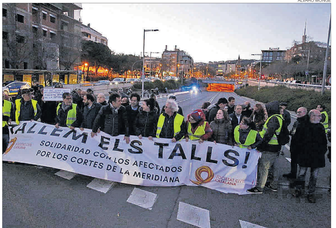
▶ Tall simbòlic ▶ Membres d'SCC i simpatitzants, en ple tall del túnel de Vallvidrera.