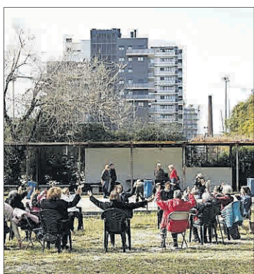
▶ Activitat a la Magòria.

➔ El nou hospital estarà dirigit a pacients crònics, convalescents (fins a 30 dies), subaguts (crònics amb previsió d'alta en 10 dies), pal·liatius i de llarga durada, així com a