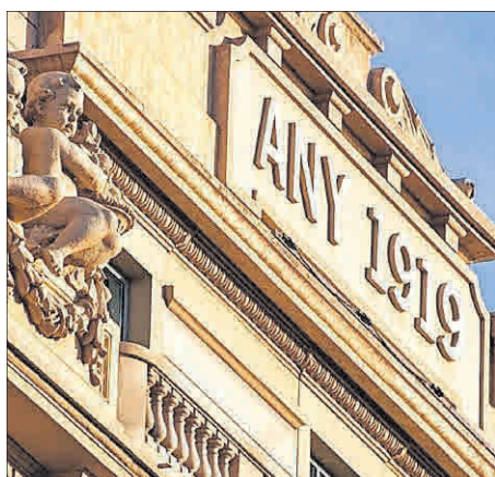
►► Detall de la façana, on es llegeix l'any d'obertura, el 1919.

IDEOLOGIES DIFERENTS // Si les seves parets parlessin explicarien fins i tot els somnis de personatges que van de la política a Hollywood. Allà han dormit banquers, monarques de mig Europa, artistes i escriptors, com Sofia Loren, Frank Sinatra –una microestada durant l'avaria d'un avió–, María Callas, Woody Allen, Jacinto Benavente, Josep Pla... També s'hi han allotjat ideologies i esperits antagònics, des del cap en persona de la SS,