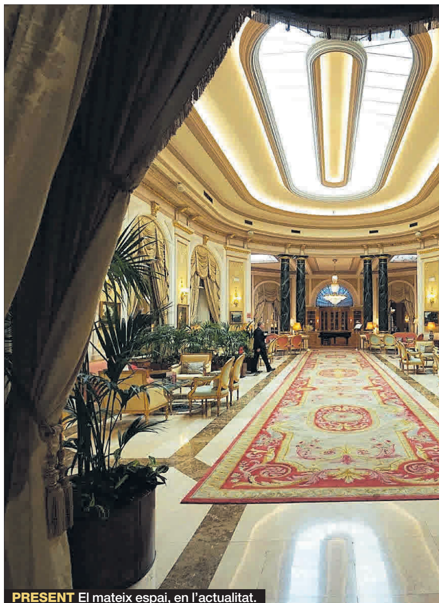
PRESENT El mateix espai, en l'actualitat.